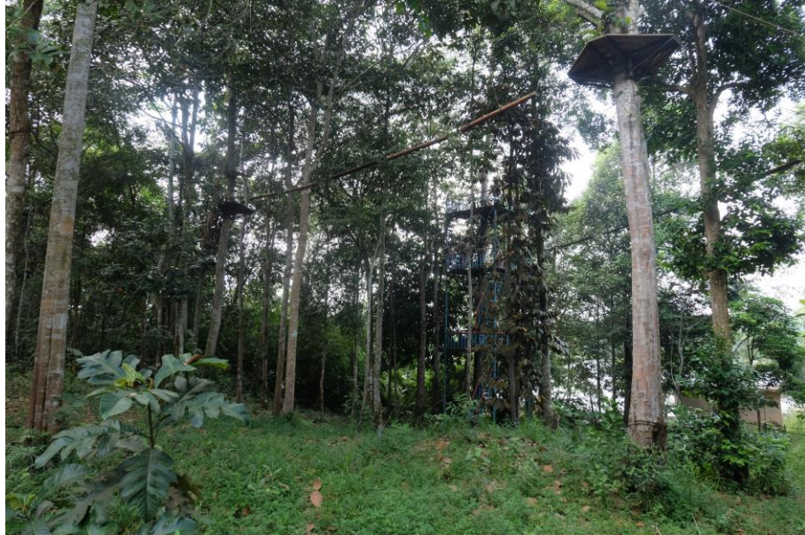
Gambar 3.3 Perjalanan menuju Perbukitan Danau Bandar Khayangan Lembah Sari

pengunjung sambil menikmati pemandangan danau dari puncak tertinggi.