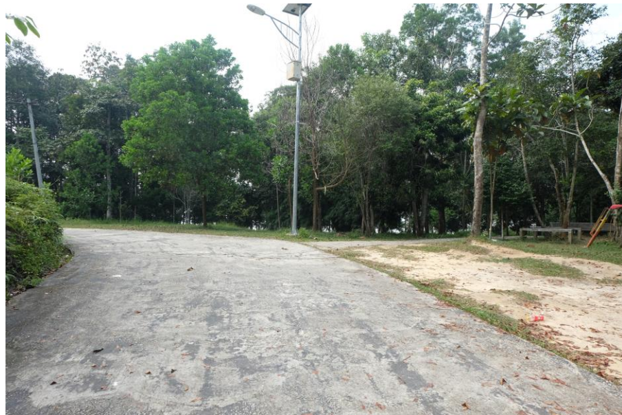
Gambar 3.7 Akses Menuju Lokasi

Aksesibilitas yang terdapat di Kawasan Wisata Danau Bandar Khayangan Lembah Sari adalah transportasi berupa angkutan umum, ojek, kendaraan pribadi dan bis. Untuk jarak tempuh dari pusat kota menuju Kawasan Wisata Danau Bandar Khayangan Lembah Sari sekitar 20 menit.