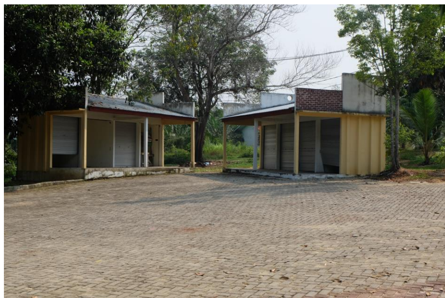
Gambar 3.6 Kios Makan dan Minum

Hotel yang terdapat di sekitar kawasan tidak ada maupun penginapan yang berada menuju lokasi tersebut. Untuk restoran sendiri terdapat beberapa restoran yang berada di lokasi dengan kondisi yang cukup baik. Di dalam kawasan ini sudah terdapat kios makanan walaupun hanya terdapat 1 kios makanan yang menjual minuman.