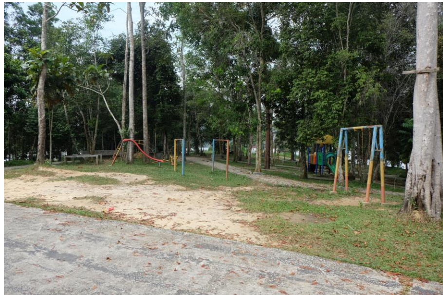
Gambar 3.4 Taman dan Kebun

Bangunan dan infrastruktur Pariwisata yang terdapat di Kawasan Wisata Danau Bandar Khayangan Lembah Sari berada dalam kondisi cukup, karena sudah ditata pada saat sebelum kegiatan PON XVIII di Kota Pekanbaru.