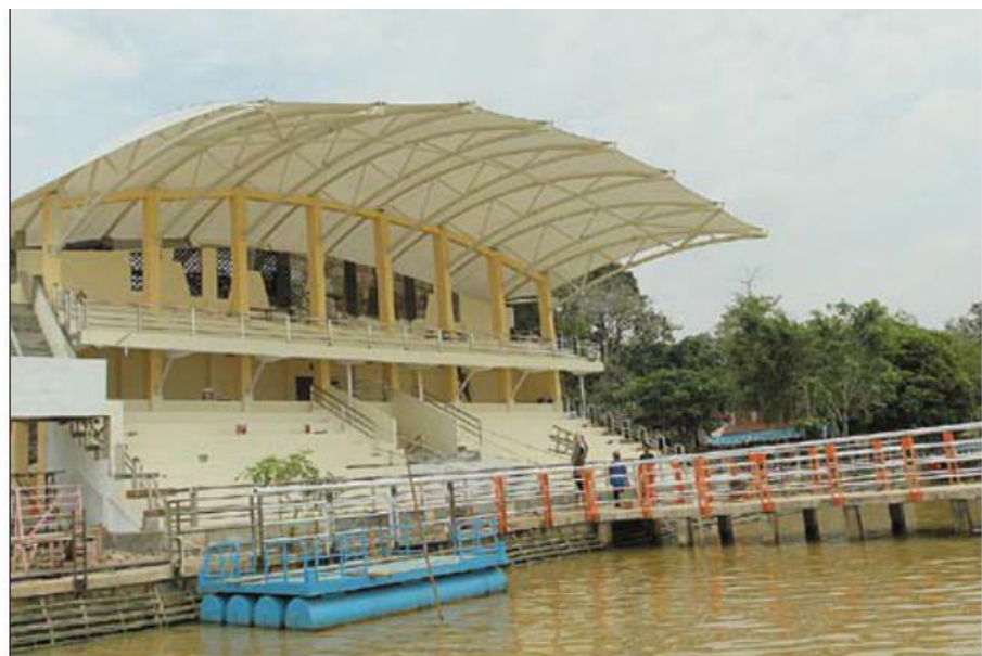
Gambar 3.5 Bangunan Dermaga dan Area Penonton

Bangunan dan infrastruktur Pariwisata yang terdapat di Kawasan Wisata Danau Bandar Khayangan Lembah Sari berada dalam kondisi cukup, karena sudah ditata pada saat sebelum kegiatan PON XVIII di Kota Pekanbaru.