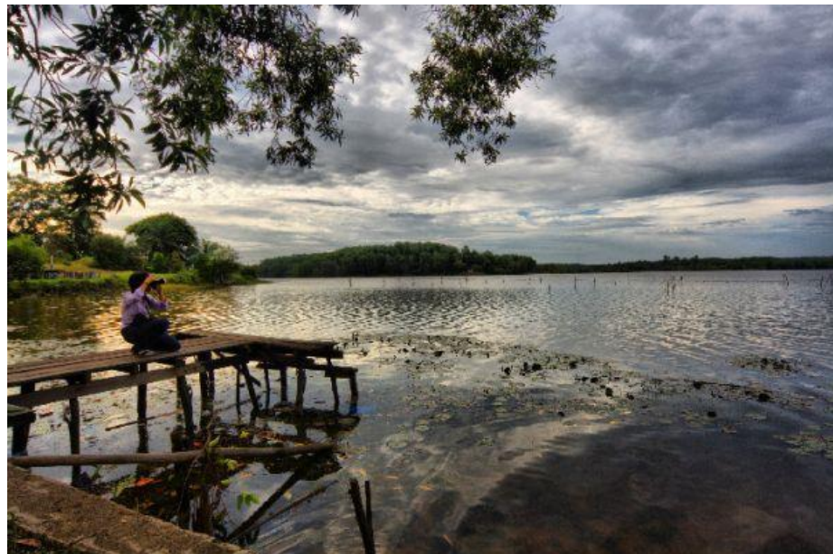
Gambar 3.2 Danau Bandar Khayangan Lembah Sari

Untuk perbukitan, di Kawasan Wisata Danau Bandar Khayangan Lembah Sari terdapat perbukitan yang mengelilingi danau. Pada puncak bukit tersebut terdapat sebuah bangunan yang memiliki atap seperti panggung terbuka tanpa dinding pembatas. Tempat ini disediakan sebagai tempat bersantai dan bersenda gurau untuk para