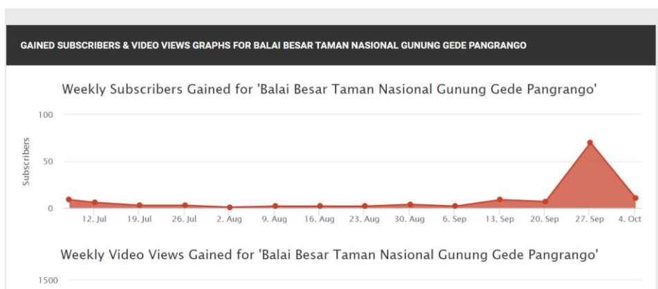
Gambar 1.5 Statistik Subscribers dan Views TNGGP