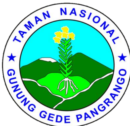
Gambar 1.1 Logo Taman Nasional Gunung Gede Pangrango

Taman Nasional adalah suatu kawasan yang masih alami baik berada di daratan ataupun lautan sehingga hal tersebut dapat menciptakan keharmonisan ekologis dan membentuk jaminan untuk generasi di masa depan. (IUCN:2008)