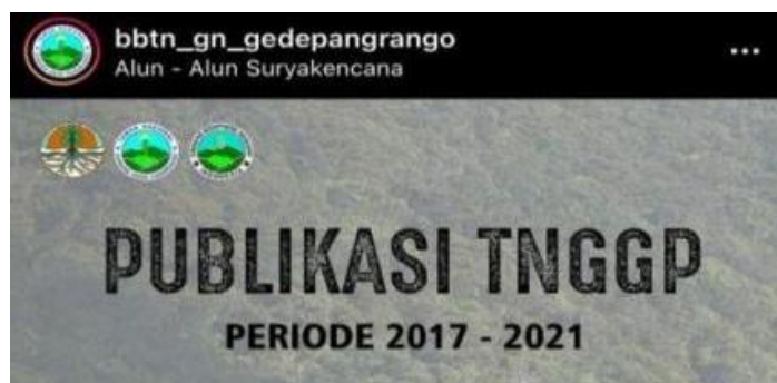
Gambar 1.3 Publikasi Media Sosial TNGGP

Hal ini sangat mempengaruhi strategi komunikasi pemasaran TNGGP karena Youtube TNGGP memiliki rating yang terus menurun dalam hal kunjungan dan subscriber yang pada kenyataannya Youtube dapat menjadi pilihan media informasi bagi calon pengunjung mengenai TNGGP dibandingkan dengan media sosial lain youtube memiliki durasi penayangan video lebih lama dan dapat diakses oleh berbagai kalangan hal ini dapat dilihat dari hasil survei publikasi instagram TNGGP periode 2017 - 2021 dimana Youtube mengalami penurunan jumlah pelanggan dan penonton dibandingkan dengan media lainnya.