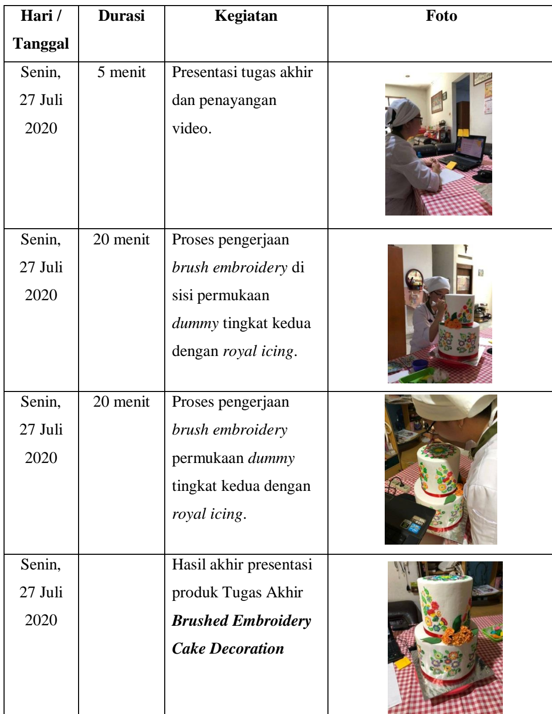
TABEL 1 DOKUMENTASI PROSES UJIAN PRESENTASI PRODUK