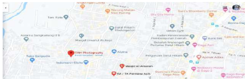
GAMBAR 1.2 Gambar Denah Lokasi Rental Linen Solution

Untuk kontak pemesanan penyewaan Linen di Retail Linen Solution bisa menghubungi via Whatsapp kami di 089602676881 atau bisa menghubungi No. Tlp 022 2504835.