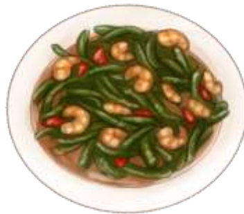
GAMBAR 4 ILUSTRASI CAH PAKIS

Cah Pakis merupakan sayuran yang banyak ditemui di Kota Ketapang. Sayuran yang merupakan ciri khas suku Dayak ini memiliki pengaruh dari suku tionghua yaitu dengan menambahkan tauco kedalam tumisan pakis tersebut. Selain tauco, udang juga merupakan komoditi yang sering ditemukan didalam cah pakis. Hal ini disebabkan karena dekatnya jarak pesisir pantai yang menyebabkan masyarakat Kota Ketapang memanfaatkan boga bahari yang melimpah kedalam sajian kulinernya.