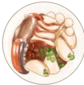
GAMBAR 1.1 ILUSTRASI MIE KEPITING

Mie Kepiting, merupakan makanan yang sering dijumpai di Ketapang. Mie Kepiting sendiri merupakan makanan peranakan tionghua yang dibawa ke Ketapang melalui jalur perdagangan. Kata mie sendiri berasal dari dialek Hokkian dari kata Mian . Mie kepiting disajikan dengan hekung, udang rebus, bakso ikan, daging kepiting rebus, taube dan kuah yang terbuat dari kaldu ikan. Karena letak pantai yang tergolong dekat dari pusat kota, maka daging kepiting dan udang hanya dimasak dengan cara direbus. Hal ini dilakukan karena tingkat kesegaran bahan yang tinggi, jadi walaupun hanya direbus, daging udang dan kepiting memiliki rasa yang manis dan tidak berbau amis. Mie kepiting sendiri memiliki rasa yang cenderung asam dan asin karena cuka dan kecap asin yang digunakan. Sedangkan kuah kaldunya sendiri memiliki rasa yang cenderung ringan.